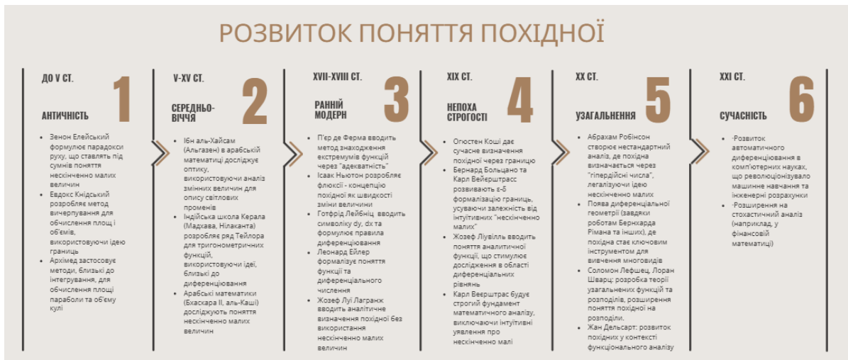
Рис. 3. Таймлайн, що ілюструє історичний розвиток поняття похідної

Таймлайн є особливо корисним при вивченні історії математики, оскільки дозволяє студентам побачити хронологію математичних відкриттів, зрозуміти взаємозв'язки між різними математичними концепціями та їх розвиток у часі (рис. 3). Це сприяє формуванню цілісного уявлення про математику як науку, що постійно розвивається.