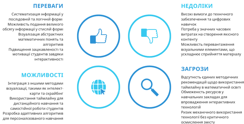
Рис. 4. SWOT-аналіз використання технології таймлайн в математичній освіті

Висновки та перспективи подальших досліджень. Сучасні технології візуалізації (скрайбінг, таймлайн) володіють значним дидактичним потенціалом для підвищення ефективності підготовки майбутніх учителів математики. Вони забезпечують одночасне залучення візуальних та аудіальних каналів сприйняття, що сприяє кращому засвоєнню абстрактних математичних понять. SWOT-аналіз кожної технології виявив як значні переваги (підвищення мотивації, розвиток різних видів мислення, можливості для індивідуалізації навчання), так і певні обмеження (часові та технічні витрати, необхідність цифрових компетенцій, ризику відволікання від математичного змісту). Ефективне впровадження технологій візуалізації вимагає поетапного підходу, дотримання балансу між формою та змістом, розвитку цифрових компетентностей викладачів та студентів, а також систематичної рефлексії щодо результативності використаних методів.