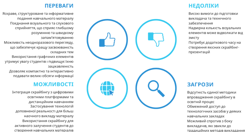
Рис. 2. SWOT-аналіз використання скрайбінгу при вивченні математики

SWOT-аналіз використання скрайбінгу у викладанні математики дозволяє оцінити його переваги та можливі ризики (рис. 2).